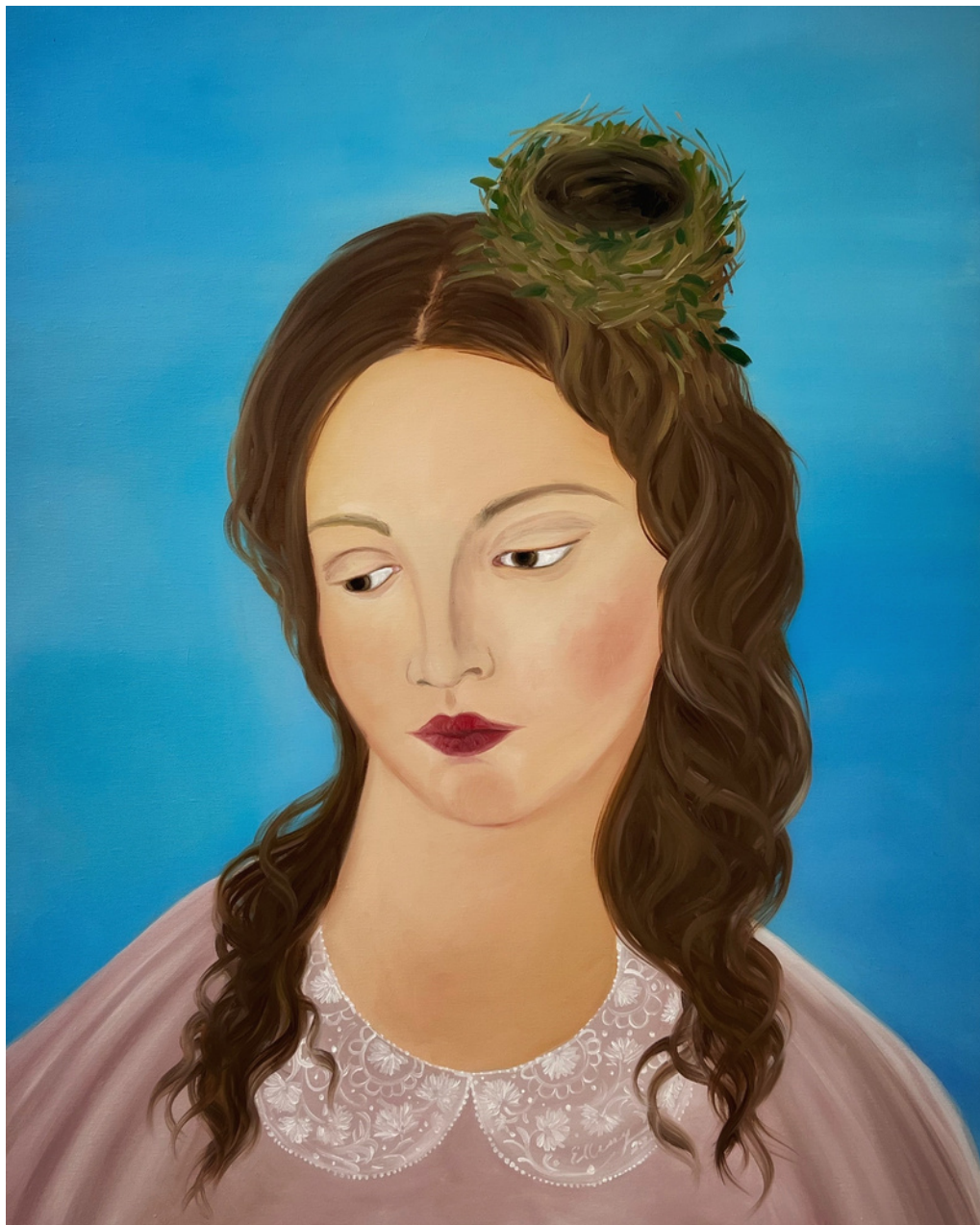
Elleny Gherghe Feeling blue, 2022 60 x 81 cm Óleo sobre lienzo 1.450 + iva €