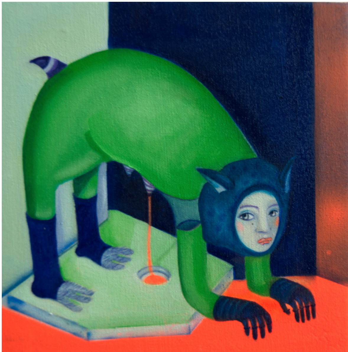
Maria Cobas Orange Milk, 2022 20 x 20 cm Oleo y spray sobre algodón 600 € + iva