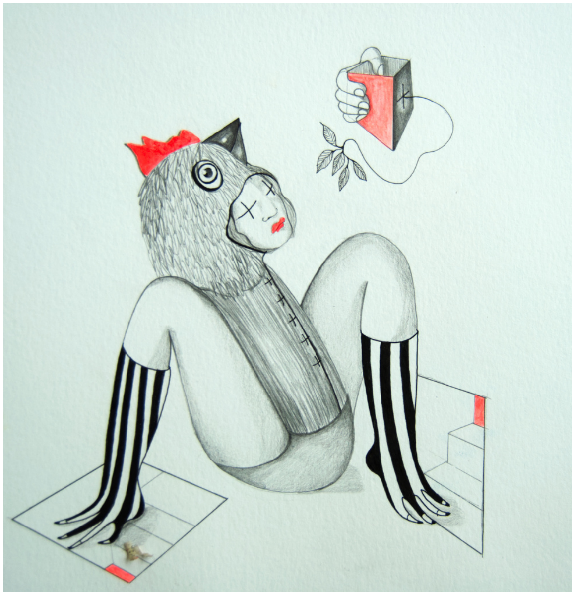
Maria Cobas Lagartija, 2022 30 x 30 cm 475 € + iva

Tinta acrílica sobre papel cosido en algodón