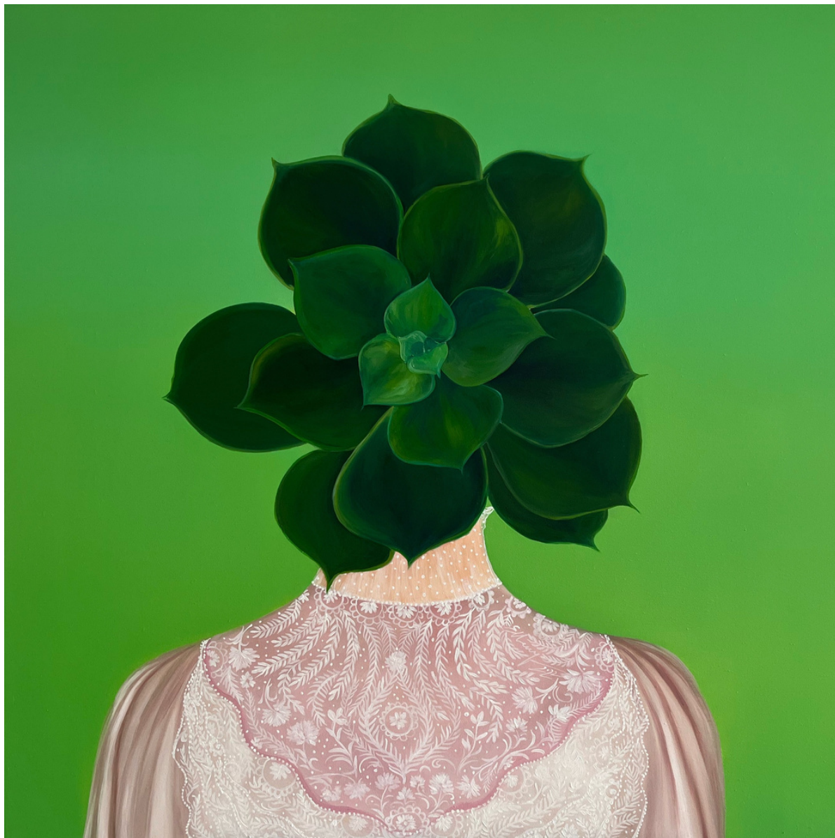
Elleny Gherghe Anima Mundi 5, 2022 100 x 100 cm Óleo sobre lienzo 2150 + iva €