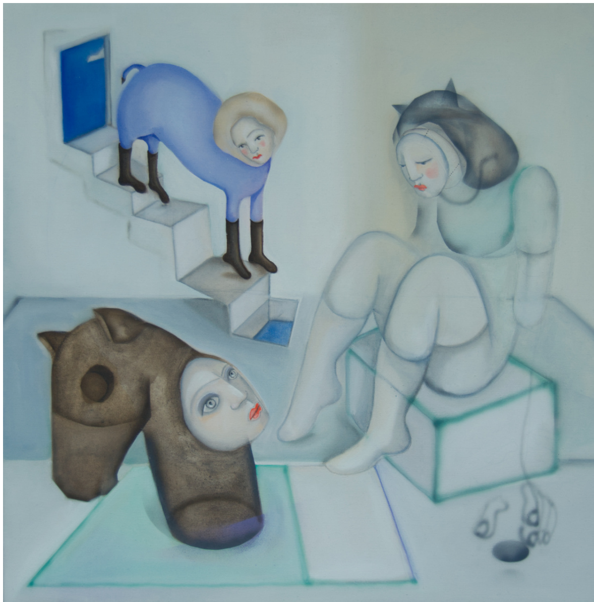
María Cobas A veces sueño, 2021 50 x 50 cm Oleo y spray sobre algodón 1.100 € + iva