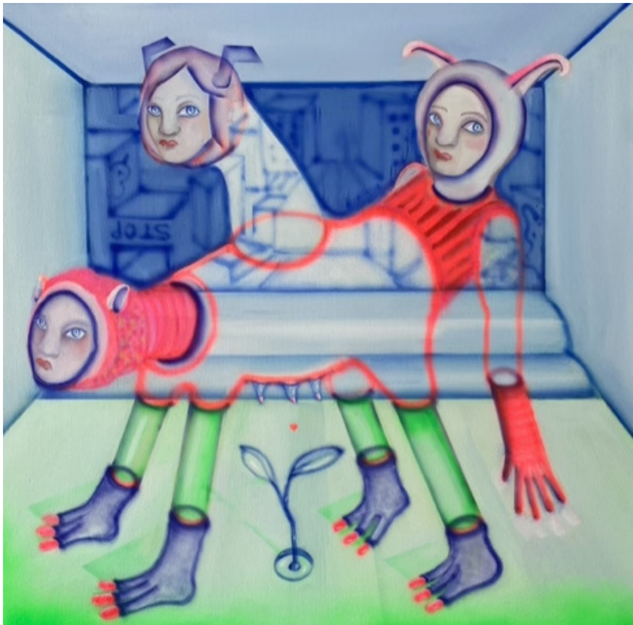
María Cobas Totopitos, 2023 38 x 38 cm Oleo y spray sobre algodón 1.100 €+ iva