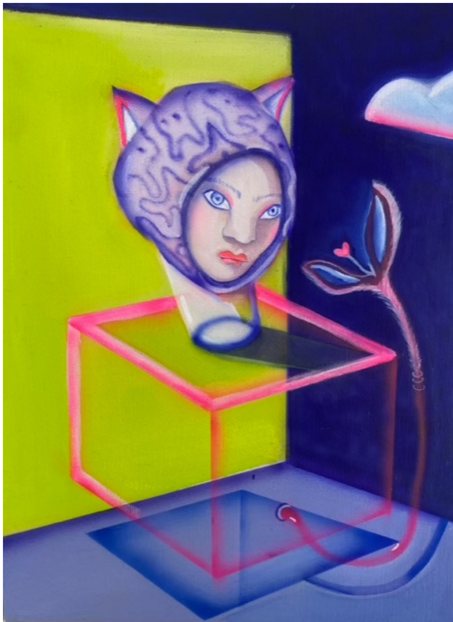
María Cobas Planta carnívora, 2023 27 x 18 cm Oleo y spray sobre algodón 600 €+ iva