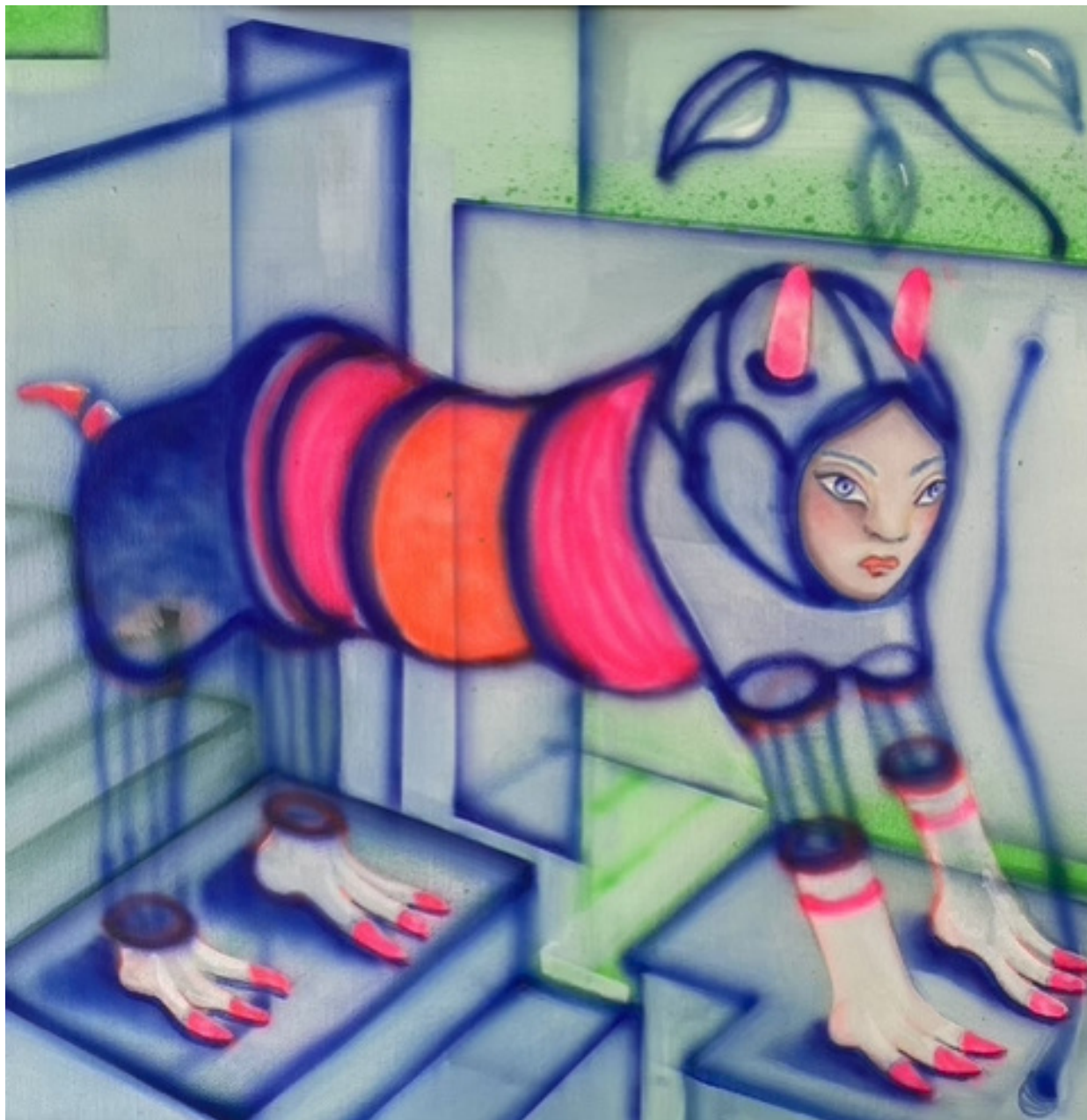
Maria Cobas Tetri - x, 2023 27 x 27 cm Oleo y spray sobre algodón 750 + iva €