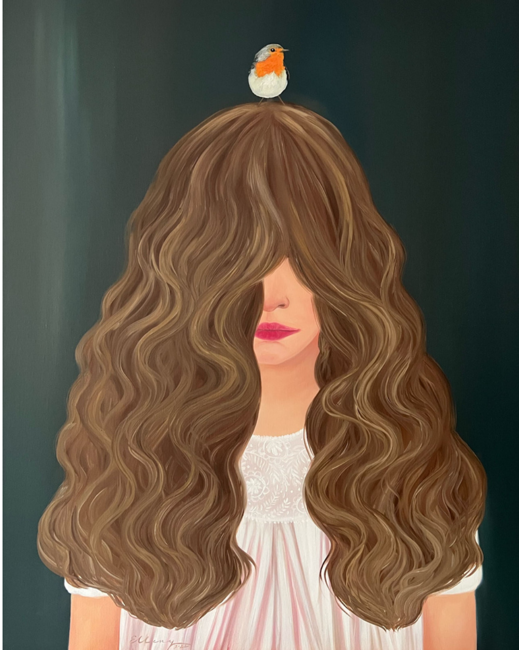
Elleny Gherghe Insomnia, 2022 73 x 90 cm Óleo sobre lienzo 1.680 + iva €