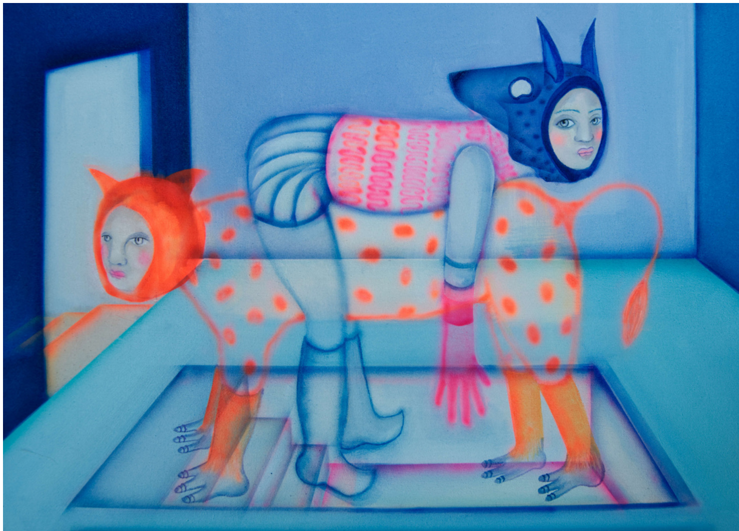
Maria Cobas Ambaas, 2022 40 x 60 cm Oleo y spray sobre algodón 1.100 €+ iva