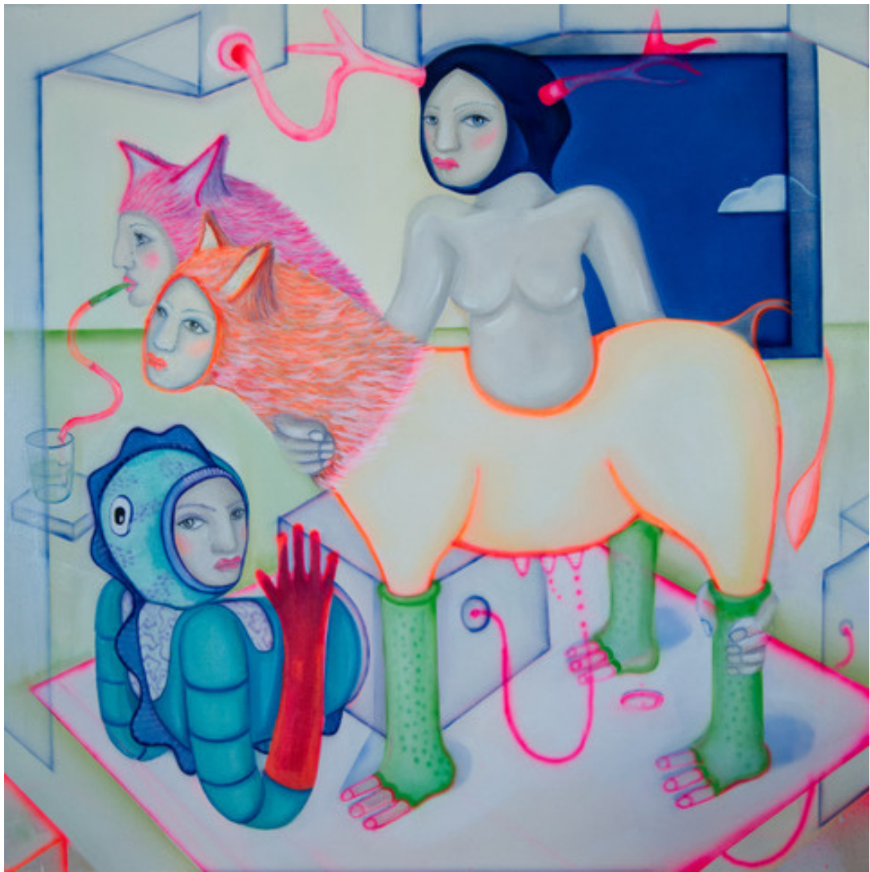
María Cobas Zumo con pajita, 2022 90 x 90 cm Oleo y spray sobre algodón 2.300 €+ iva