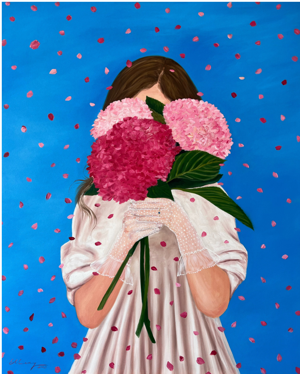
Elleny Gherghe The engagement, 2023 100 x 81 cm Óleo sobre lienzo 2.880 + iva €