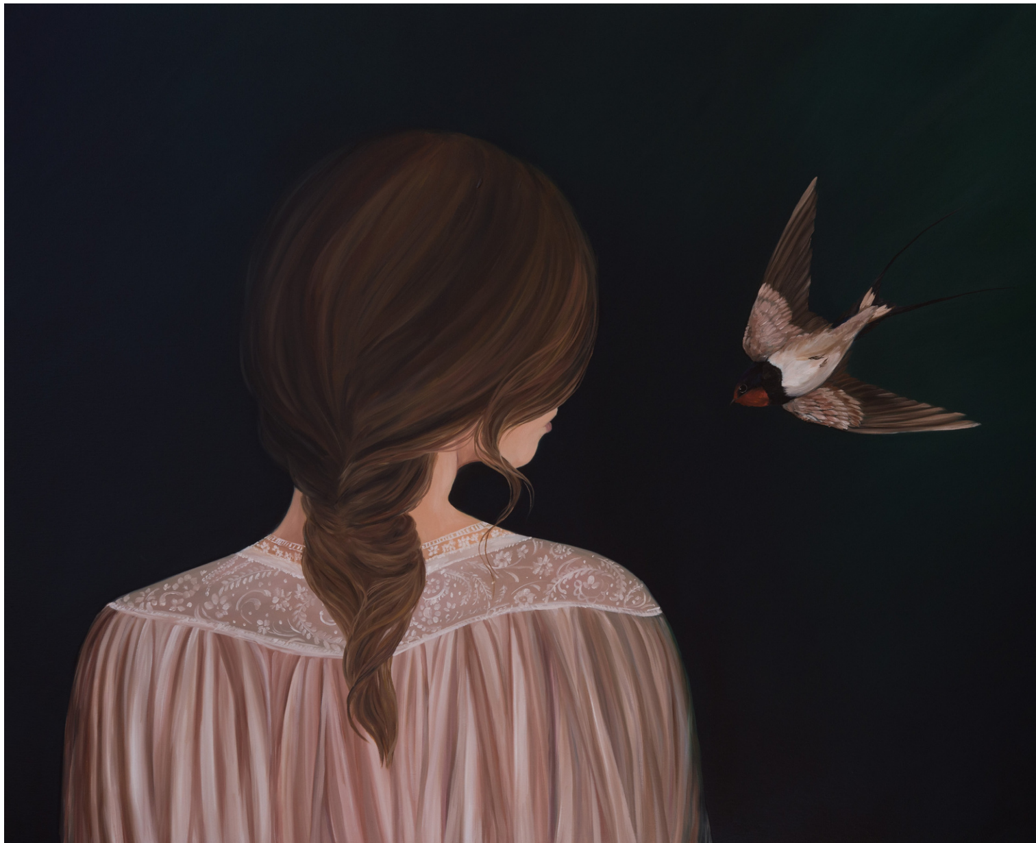
Elleny Gherghe First reverie, 2021 100 x 81 cm Óleo sobre lienzo 2150 + iva €