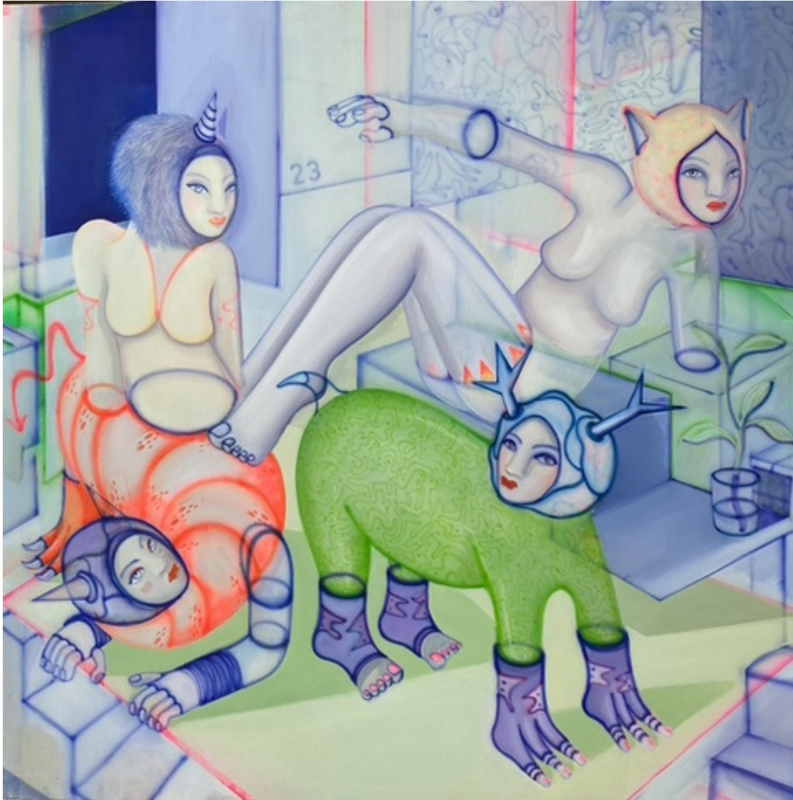
María Cobas Can I have a glass of water, 2023 115 x 115 cm Oleo y spray sobre algodón 2.750 €+ iva