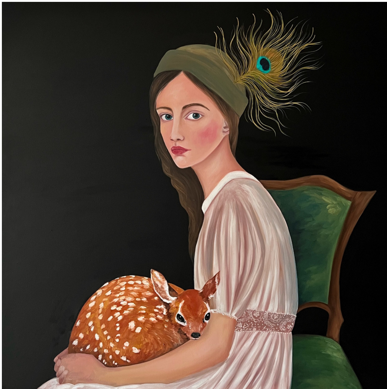
Elleny Gherghe Home at last, 2022 100 x 100 cm Óleo sobre lienzo 3.150 + iva €