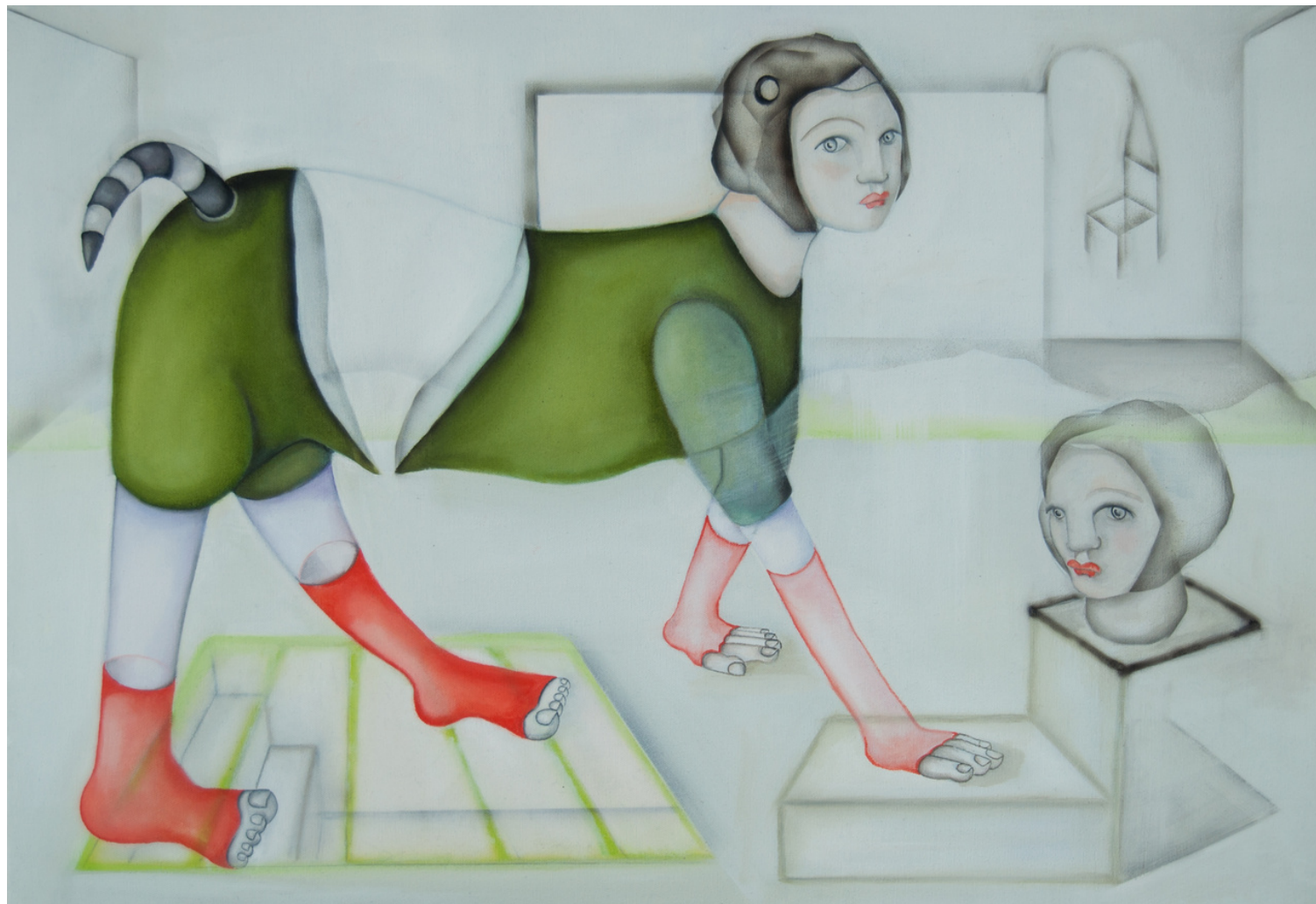
Maria Cobas Meidas rojo carmesí, 2021 65 x 45 cm Oleo y spray sobre algodón 1.150 €+ iva