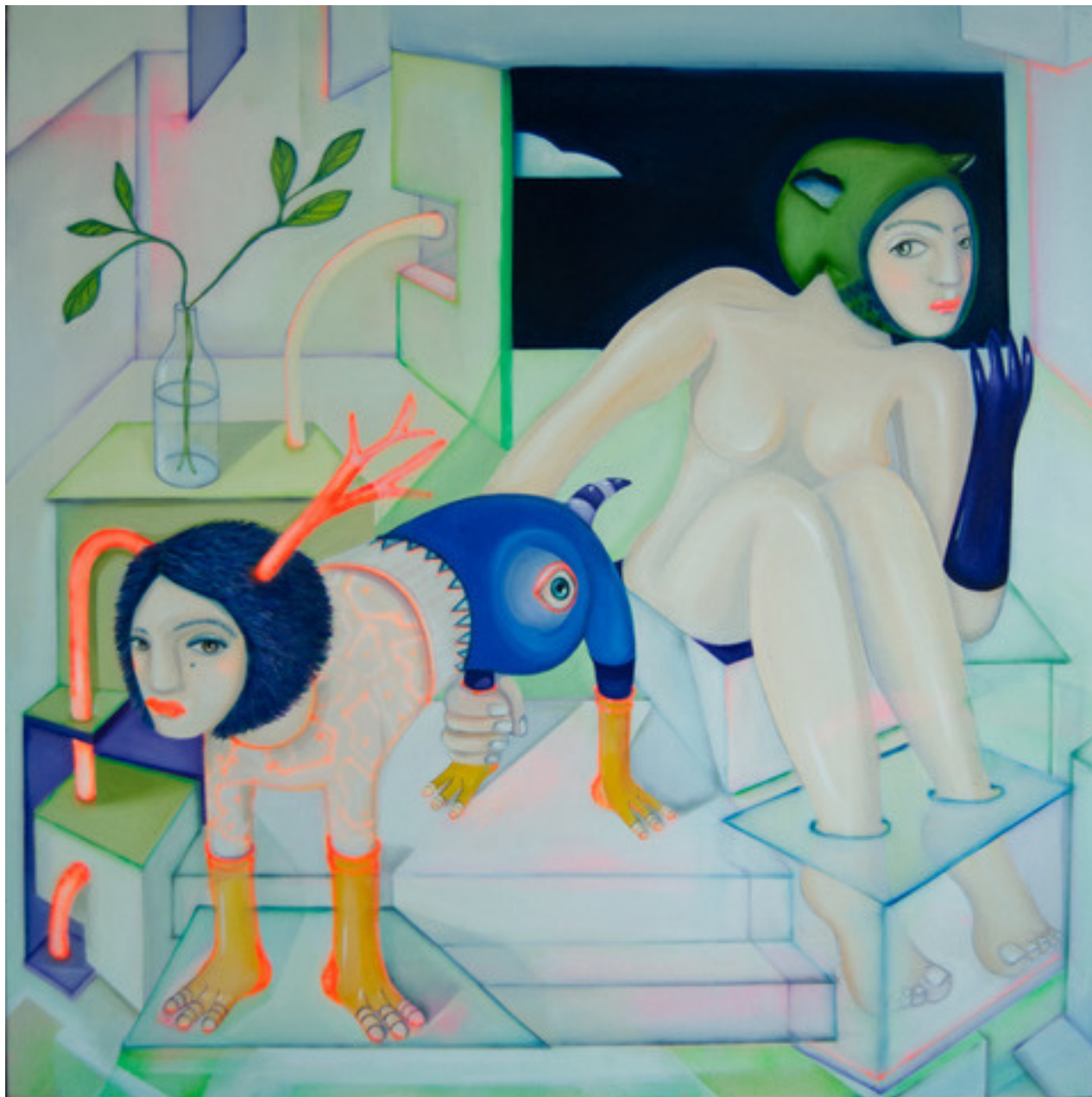
María Cobas Purple glove, 2023 92 x 92 cm Oleo y spray sobre algodón 2.300 €+ iva