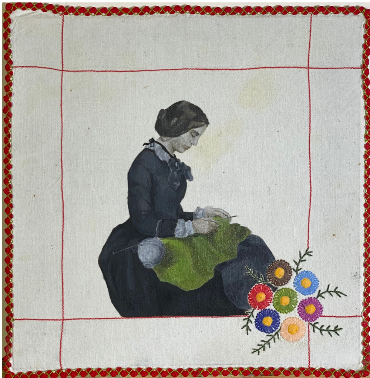
“Retrato de M a Isabella Grant” Autor original: Sir Francis Grant Óleo en servilleta bordada por Angeles Melgar Donación de Esther Gutiérrez Sánchez 28 x 28 cm P.V.P - 475 euros