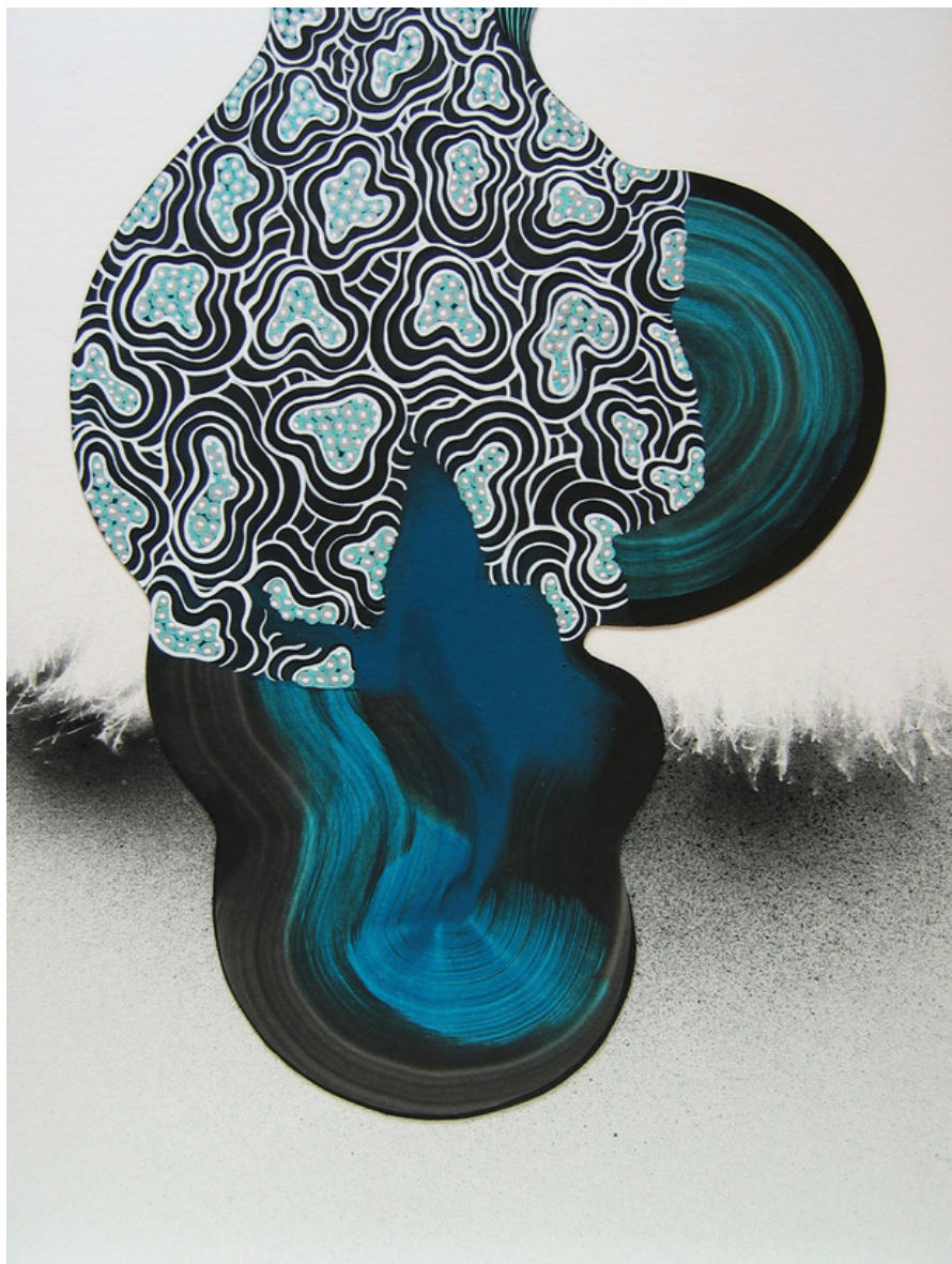
María Acuyo Sin Título (74), 2018 Acrílico sobre papel de algodón y caja de metracrílico 32 x 24 x 5 cm P.V.P - 770 euros