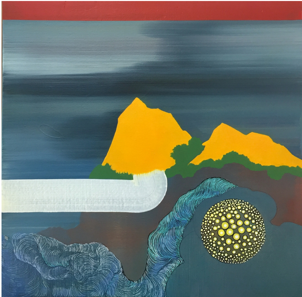
María Acuyo Sin Título, 2020 Óleo sobre lienzo. 50 x 50 cm P.V.P - 2,200 euros