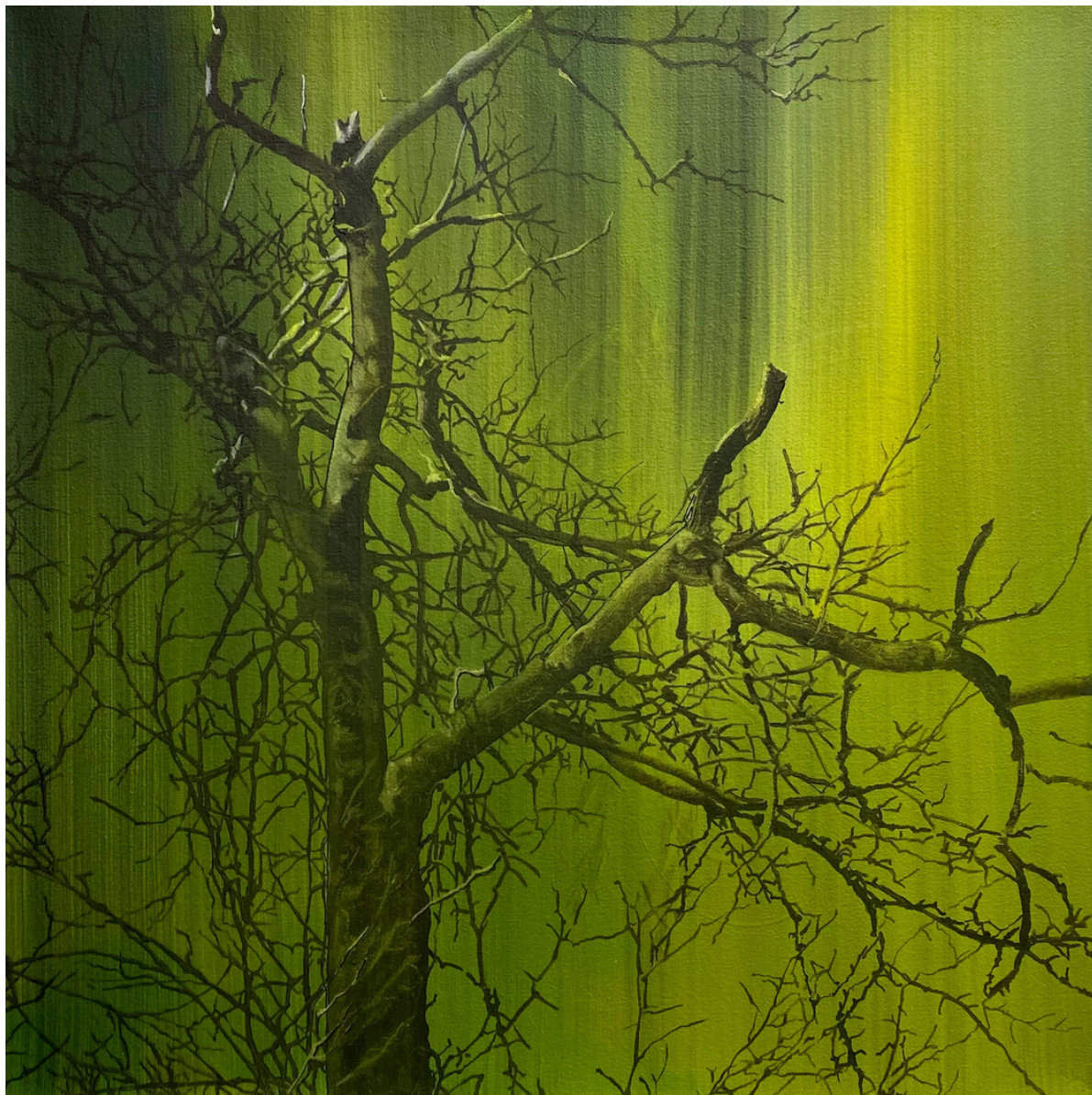
María Acuyo Sin Título, 2021 Óleo sobre lienzo. 50 x 50 cm P.V.P - 2.200 euros