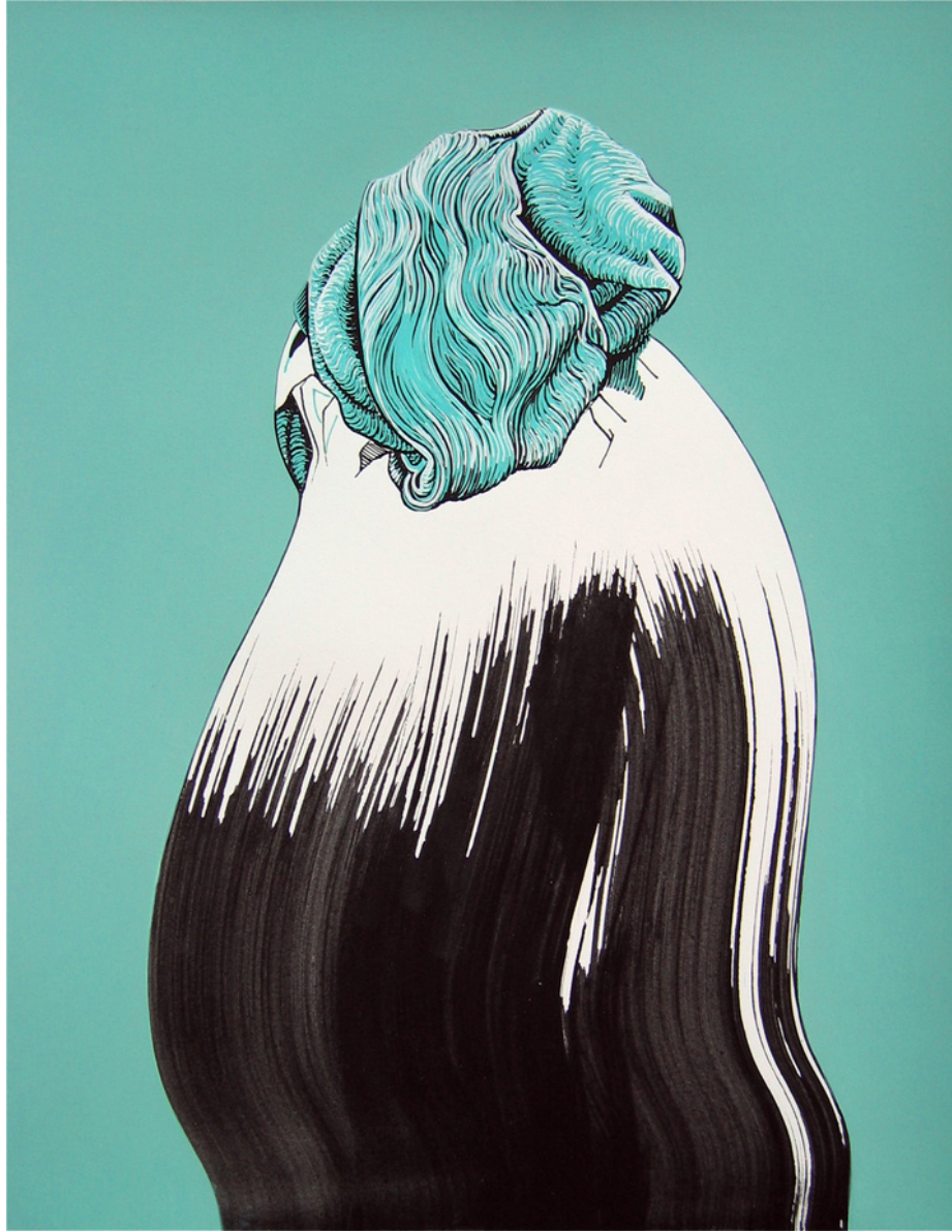
María Acuyo Sin Título (74), 2018 Acrílico sobre papel de algodón y caja de metracrílico 32 x 24 x 5 cm P.V.P - 770 euros