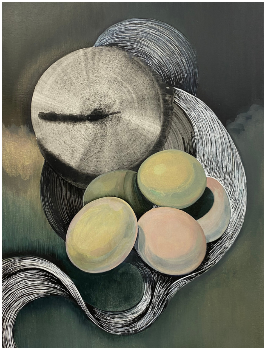
María Acuyo Sin Título (74), 2018 Acrílico sobre papel de algodón y caja de metracrílico 32 x 24 x 5 cm P.V.P - 770 euros