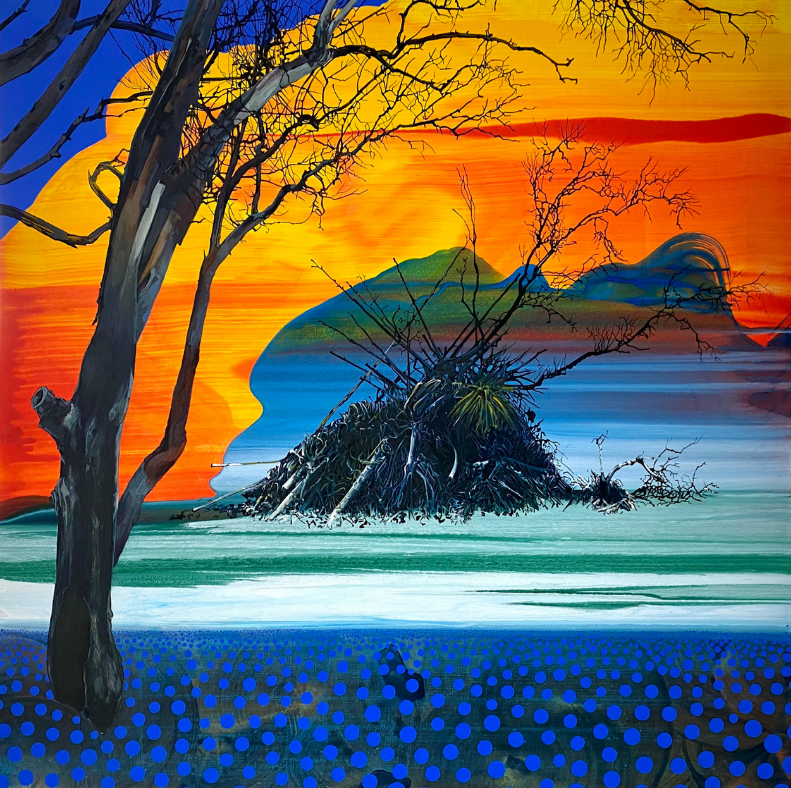
María Acuyo Sin Título, 2021 Óleo y acrílico sobre lienzo 120 x120 cm P.V.P - 3.850 euros