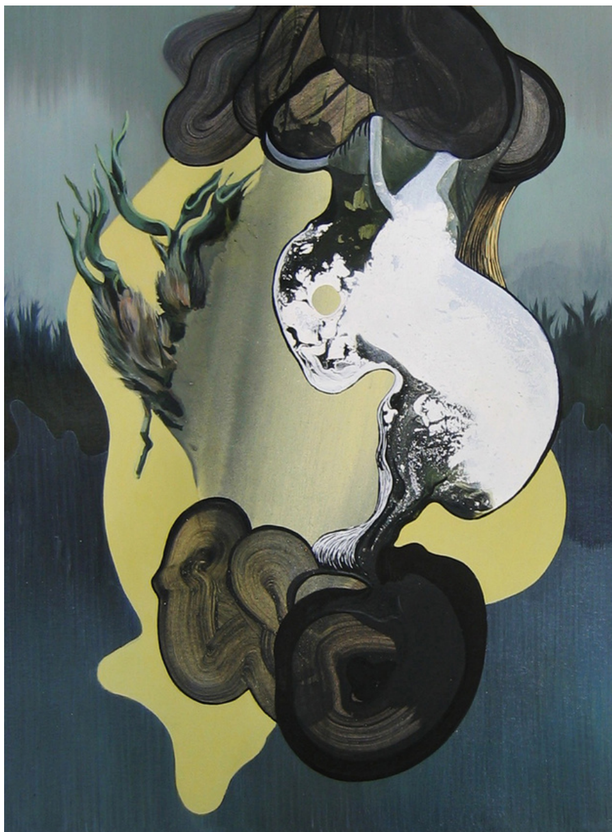
María Acuyo Sin Título (74), 2018 Acrílico sobre papel de algodón y caja de metracrílico 32 x 24 x 5 cm P.V.P - 770 euros