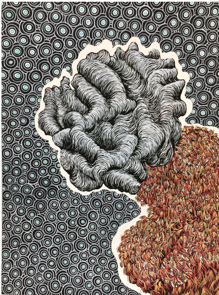
María Acuyo Sin Título (74), 2018 Acrílico sobre papel de algodón y caja de metracrílico 32 x 24 x 5 cm P.V.P - 770 euros