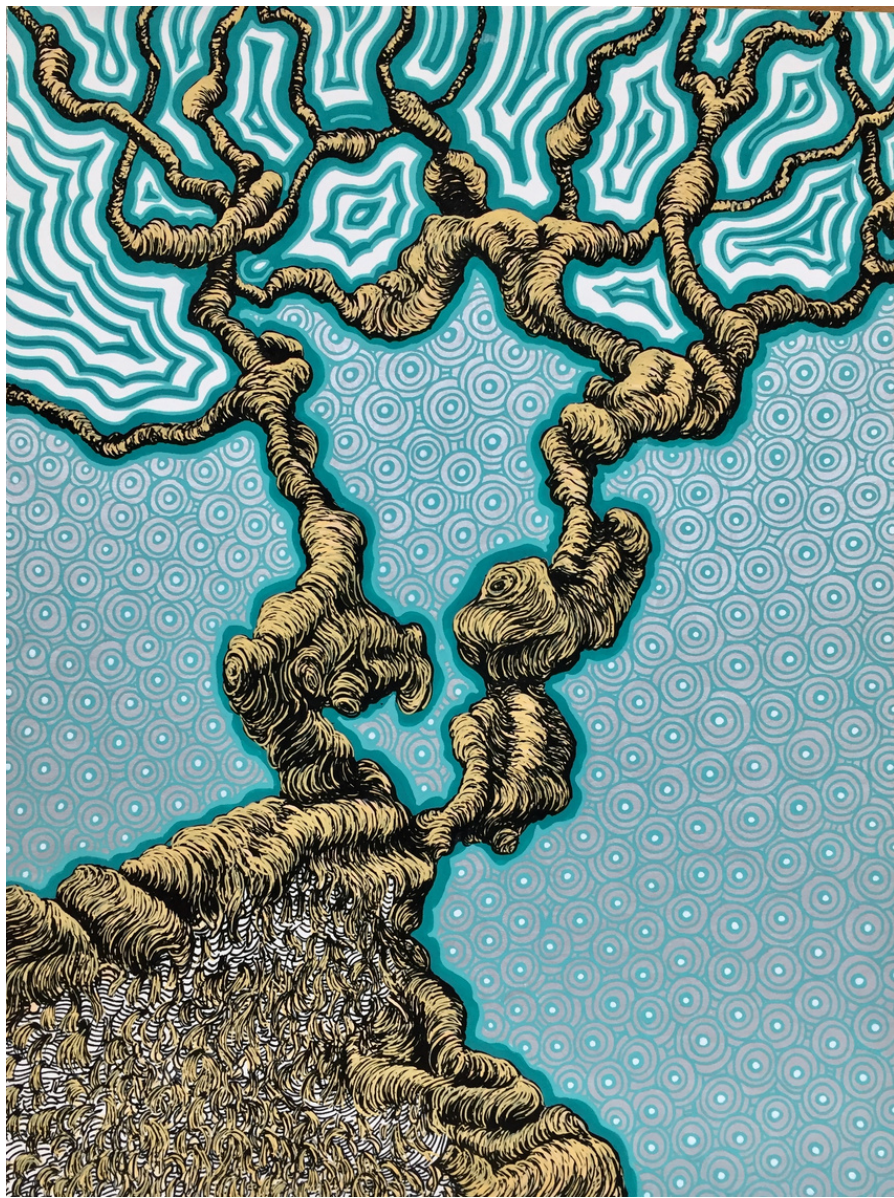
María Acuyo Sin Título (74), 2018 Acrílico sobre papel de algodón y caja de metracrílico 32 x 24 x 5 cm P.V.P - 770 euros