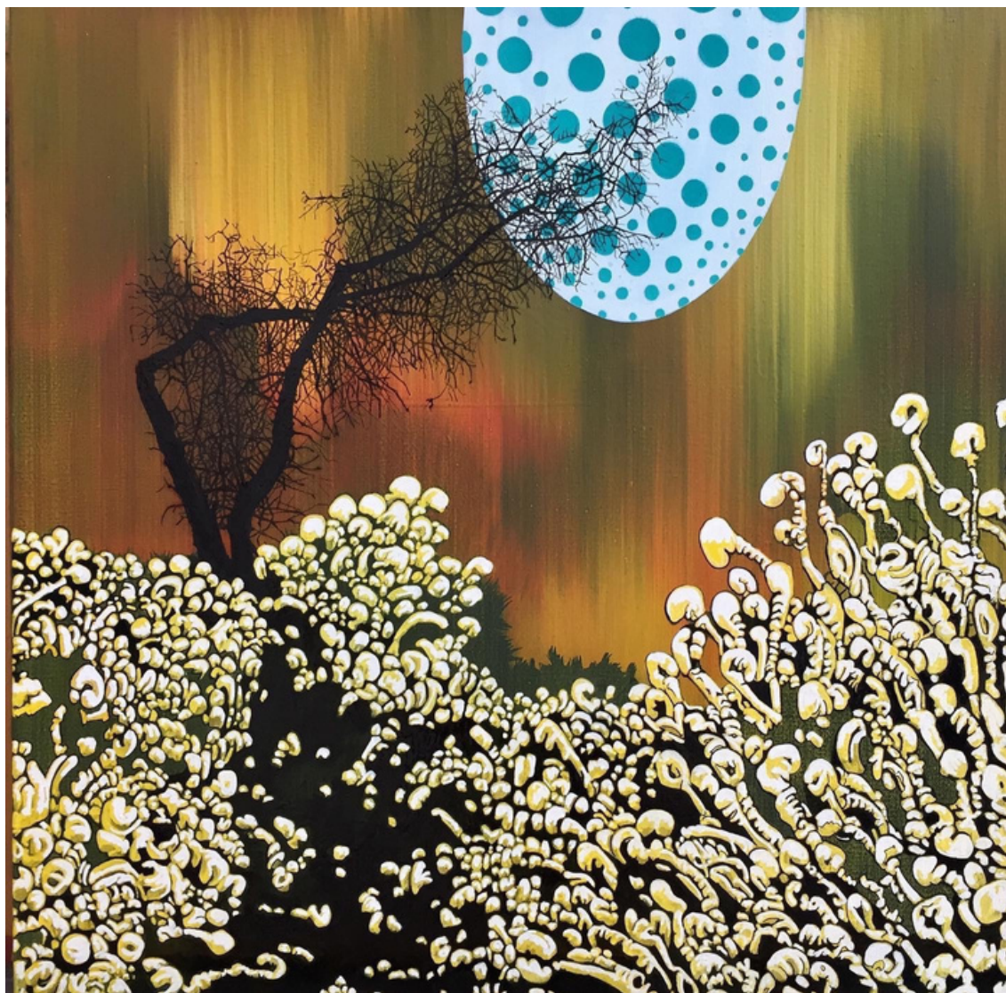
María Acuyo Sin Título, 2020 Óleo sobre lienzo. 50 x 50 cm P.V.P - 2,200 euros