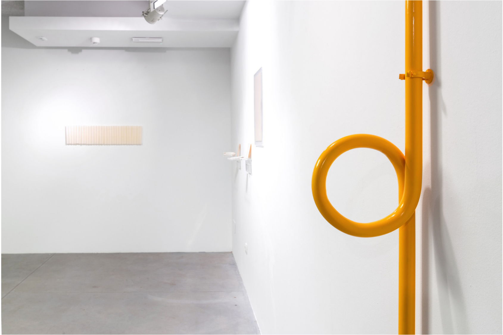
Vista de la exposicion