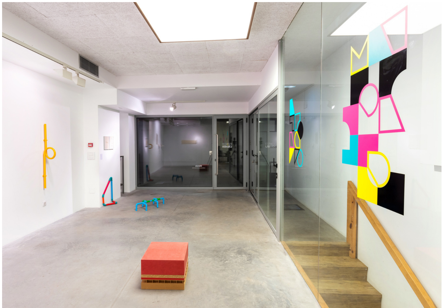
Vista de la exposicion