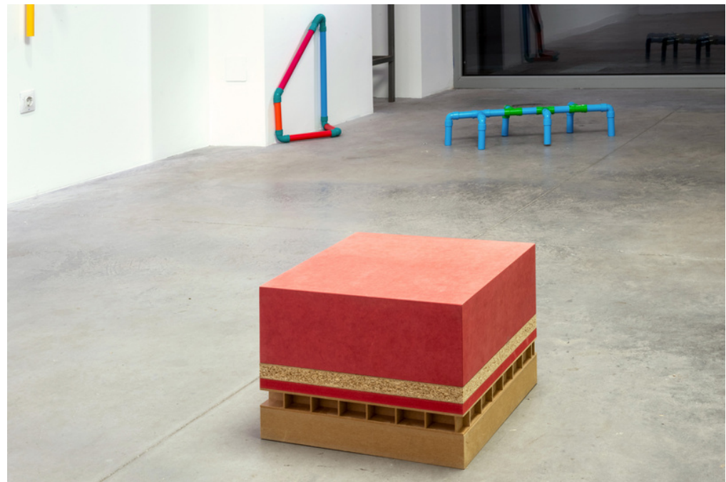
Vista de la exposicion