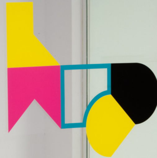
Instalacion vinilos Job Sanchez Vista de la exposicion