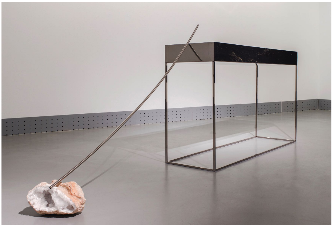
Alba Moreno & Eva Grau, Sin título, de la serie “Shore to shore”, 2017

Todas las obras son relatos o acontecimientos relacionados con el cambio constante y la ausencia de valores fijos, pero también con la creación de un paisaje propio, personal, configurador de una identidad que no se define de manera inmutable, se expresa en relación o contraste con la naturaleza y, cada una a su manera, alude al final de la utopía que supone el Antropoceno. Bien porque busca reaprender de los procesos de la naturaleza en tiempos en los que se sustituye por la técnica, bien porque pone el foco en paisajes artificiales cuando el paisaje emocional de la infancia se ha perdido para siempre. O porque trata de vincular emocional y afectivamente al espectador para que se proyecte en ella, tratando de provocar “acontecimientos” que vayan más allá de la representación o la pura reflexión. O porque se afana en intentar configurar los límites que determinan y definen cada identidad con respecto a las otras en tiempos borrosos.