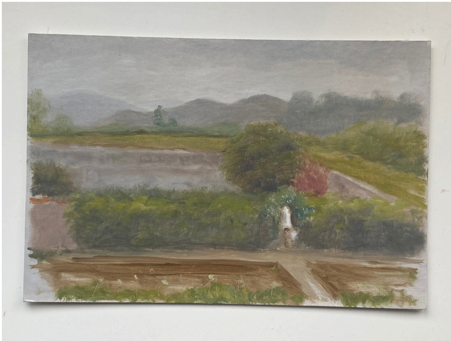
Isabel Gil Sánchez Monasterio de Escalante Oil on cardboard 16 x 24 cm. P.V.P - 160€