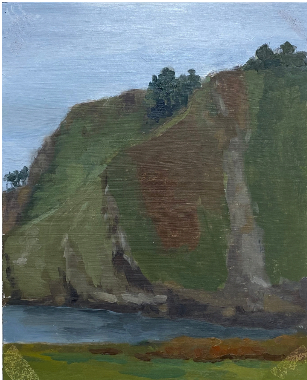
Isabel Gil Sánchez Moniello, vista de pared Oil on cardboard 21 x 17 cm. P.V.P - 150€