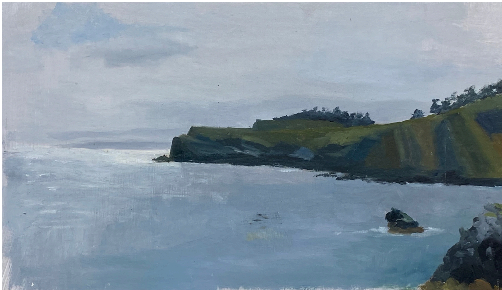
Isabel Gil Sánchez Moniello II Oil on cardboard 18 x 30 cm. P.V.P - 195€