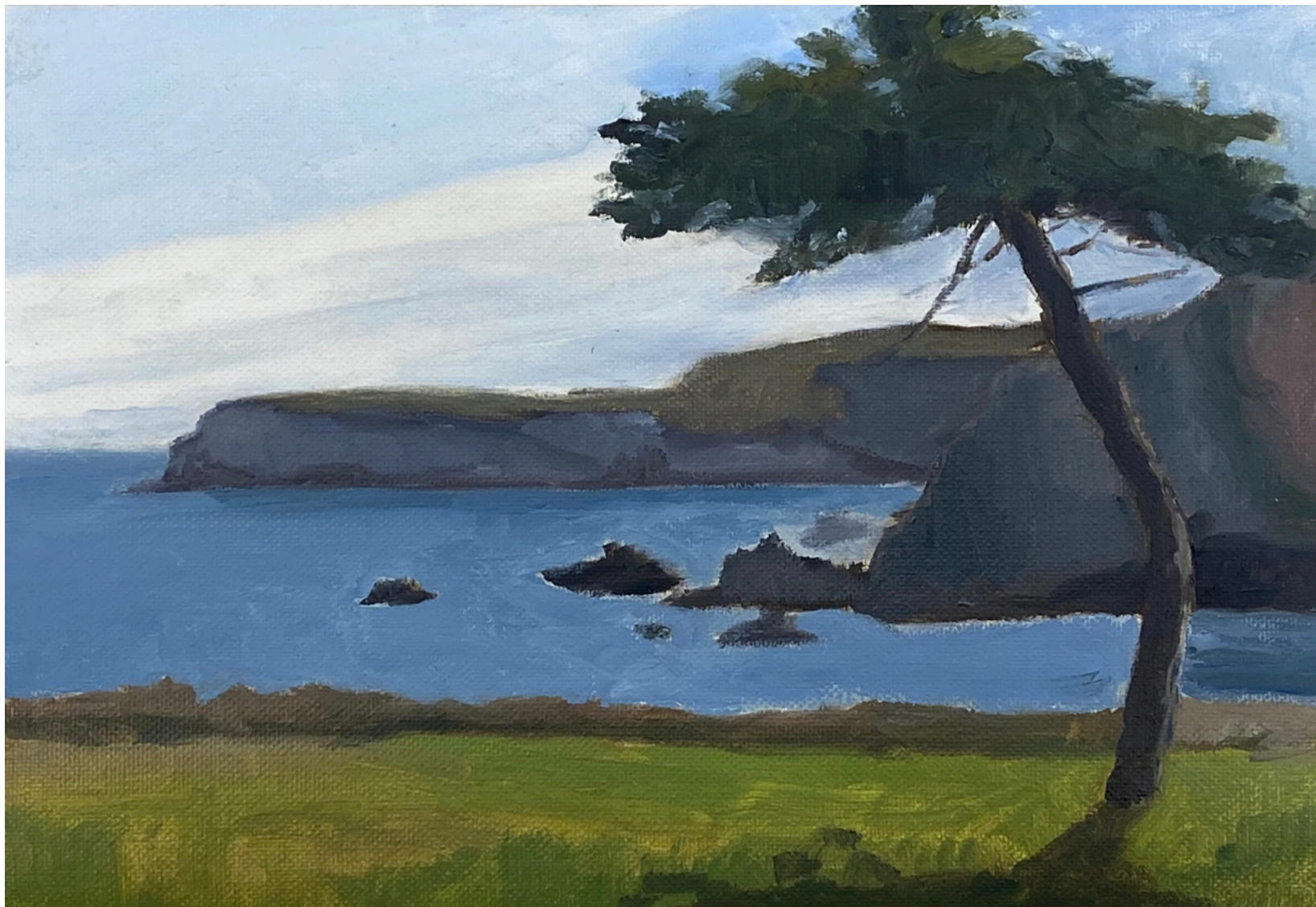
Isabel Gil Sánchez Pino y mar. Moniello Oil On Canvas 18 x 27 cm. P.V.P - 180€