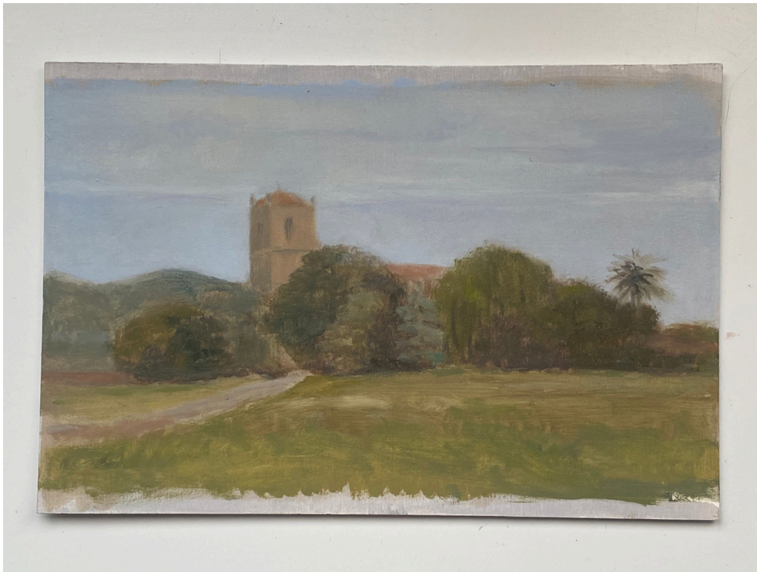
Isabel Gil Sánchez Iglesia de Escalante Oil on cardboard 16 x 24 cm. P.V.P - 160€