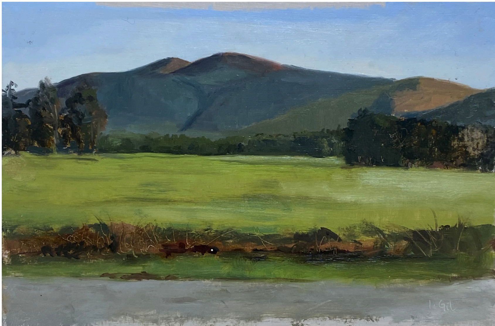
Isabel Gil Sánchez Cabo Busto Oil on cardboard 17 x 26 cm. P.V.P - 175€