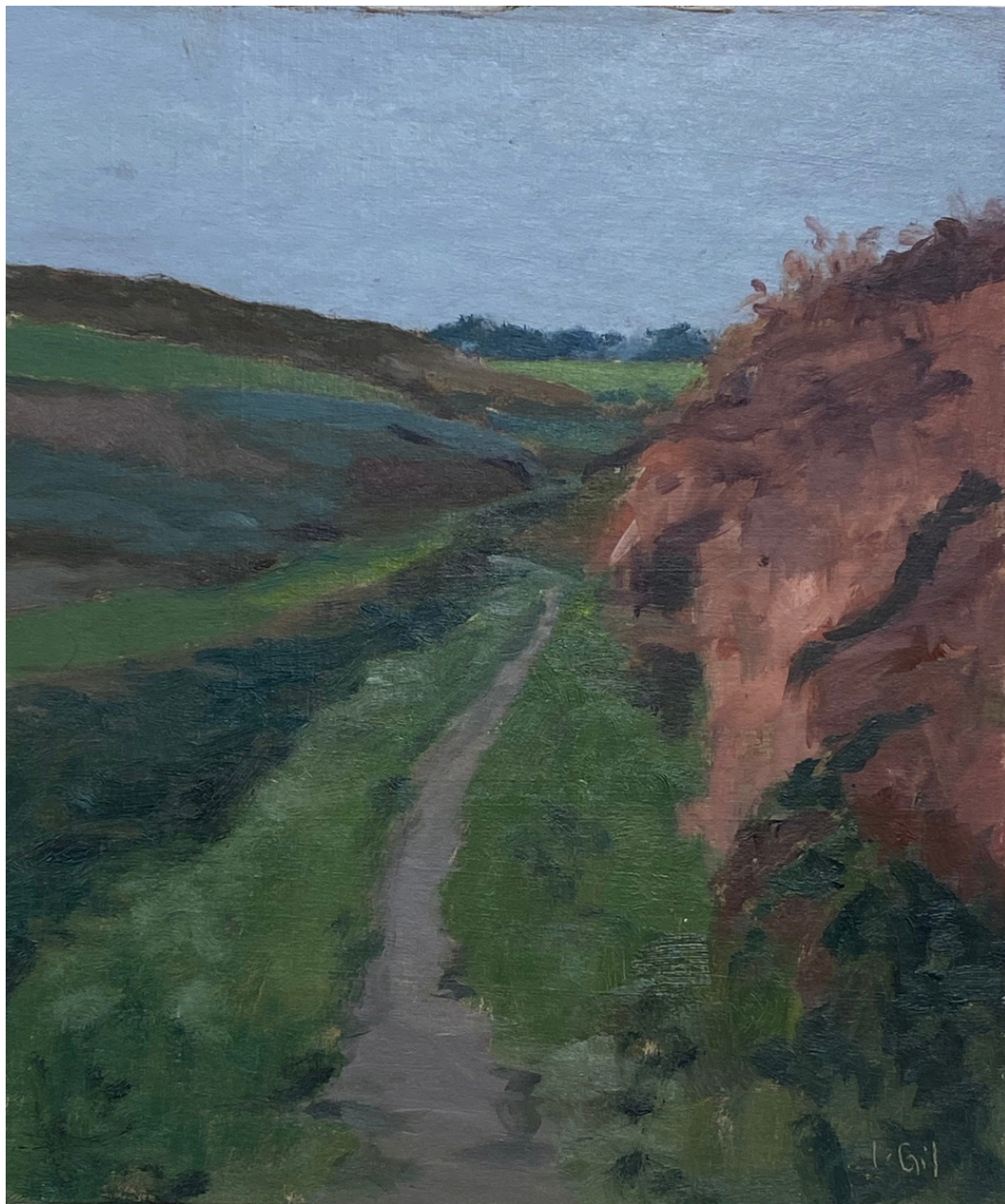
Isabel Gil Sánchez Ruta navega Oil on cardboard 18 x 15 cm. P.V.P - 90€