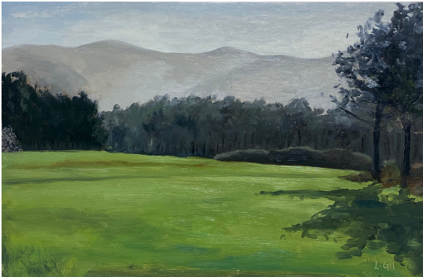
Isabel Gil Sánchez Bruma levantándose de la tierra. Cabo Busto Oil on cardboard 17 x 26 cm. P.V.P - 175€