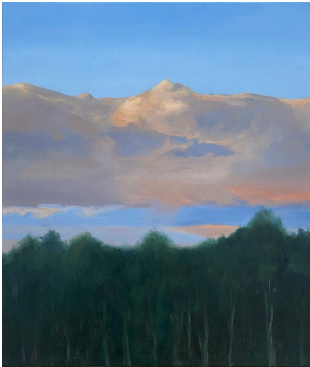
Isabel Gil Sánchez ¿Qué ves? Juego infantil Oil On Canvas 54 x 46 x 1 cm. P.V.P - 700€