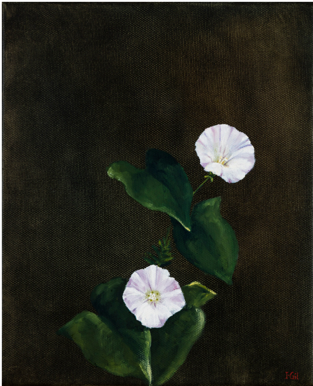
Isabel Gil Sánchez Calystegia sepium (corehuela_mayor) Oil On Canvas 22 x 27 x 1.7 cm. P.V.P - 295€