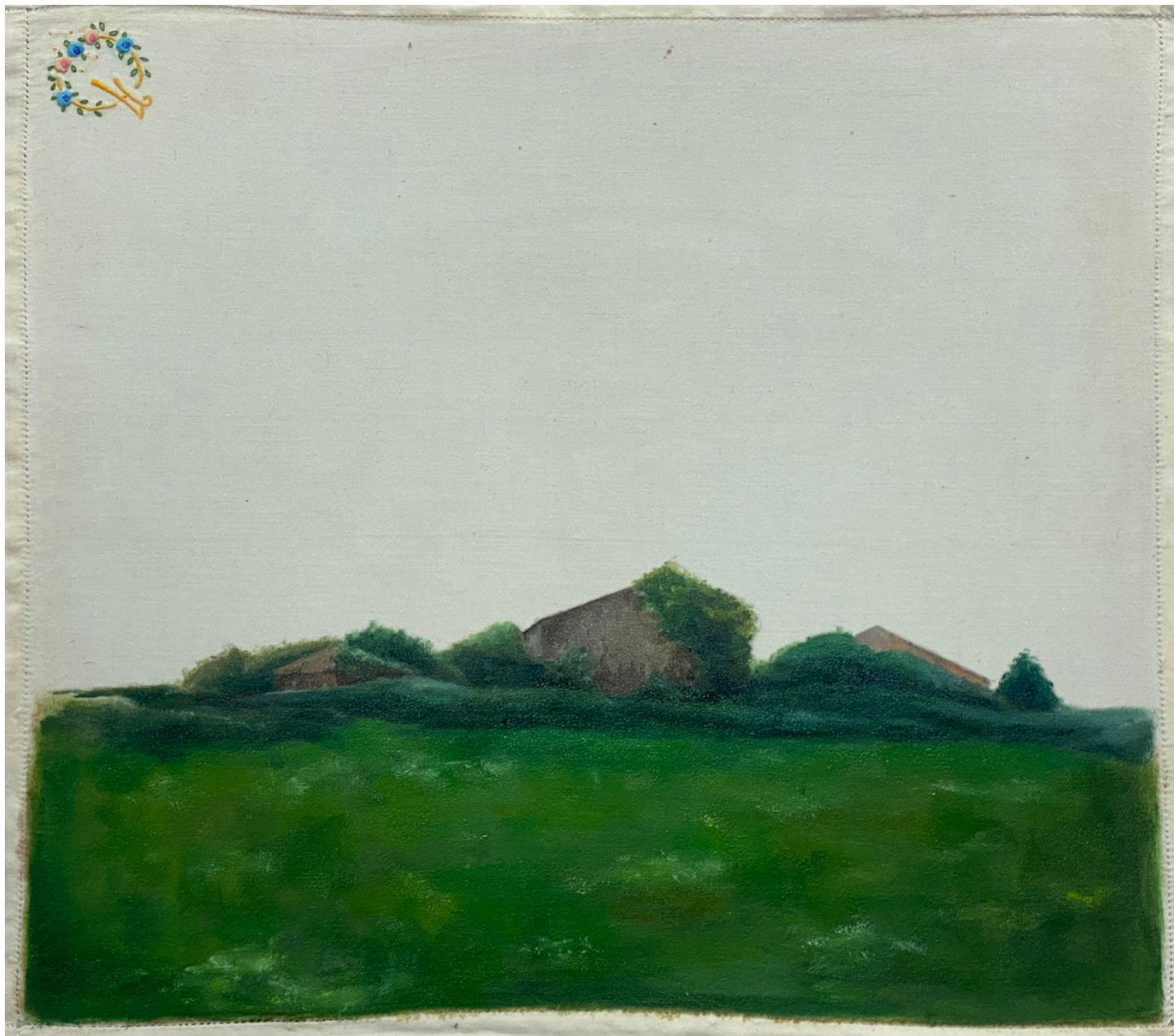
Isabel Gil Sánchez Pericones Oil On Canvas 32 x 36 cm. P.V.P - 475€