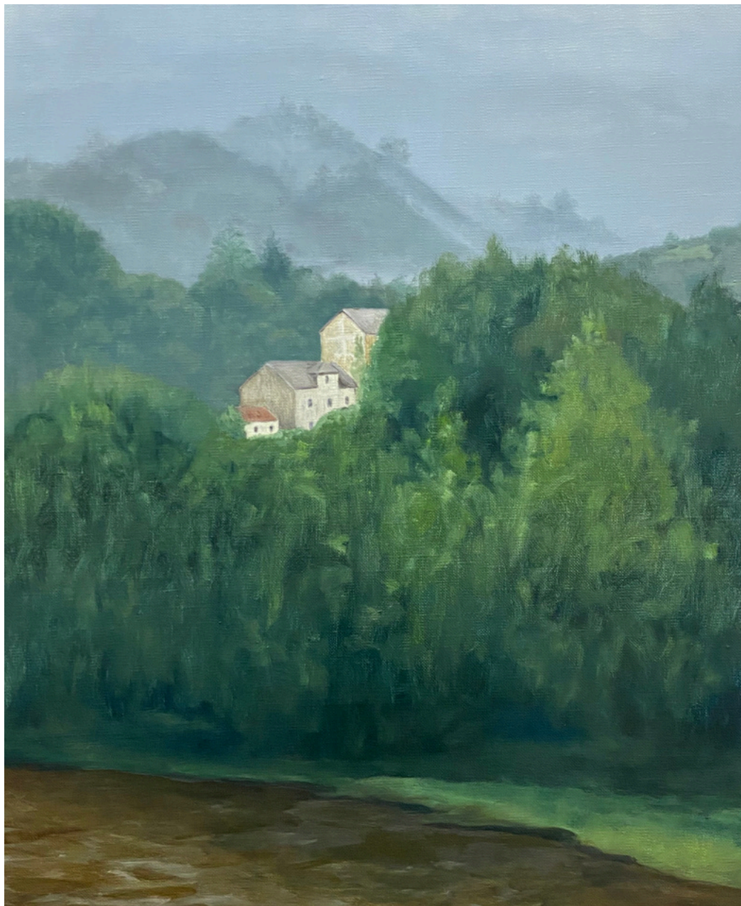
Isabel Gil Sánchez San Martín Oil On Canvas 61 x 50 x 1 cm. P.V.P - 777€