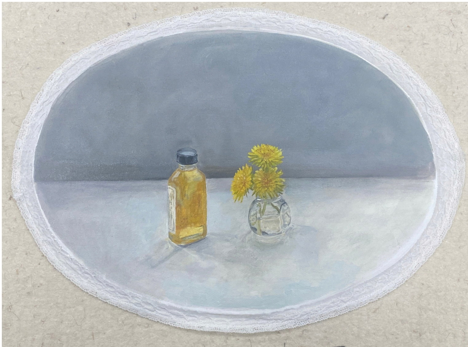
Isabel Gil Sánchez Aceite y diente de león Oil On Canvas 28 x 39 x 0 cm P.V.P - 470€