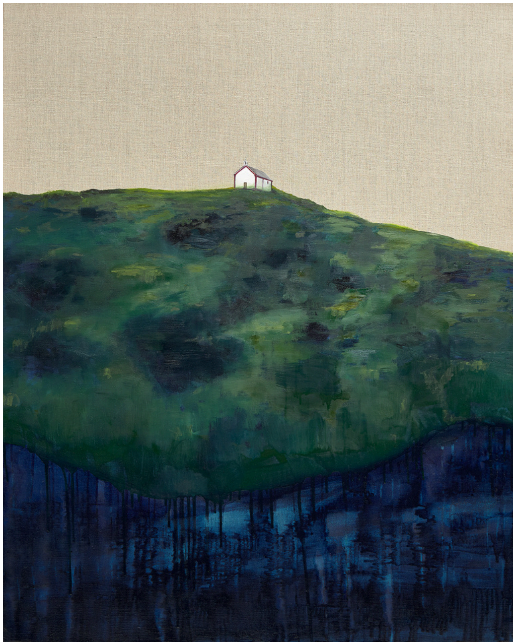
Isabel Gil Sánchez En suspenso (la tierra que nos queda) Oil On Canvas 114 x 97 x 1.7 cm. P.V.P - 1.480 €