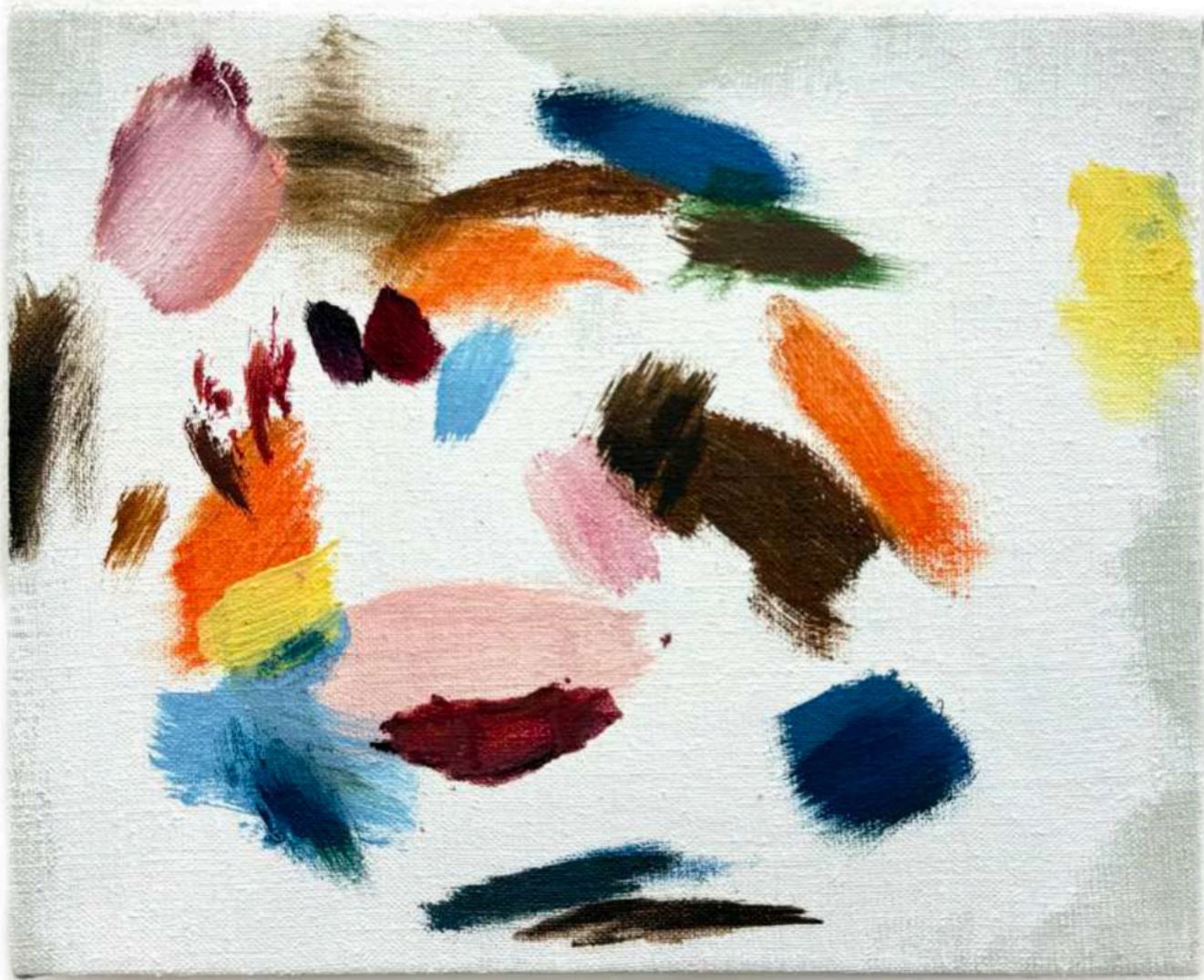
Daniel Roibal "Asiento 6 B" Oil on linen 20 x 26 cm 900 € + IVA