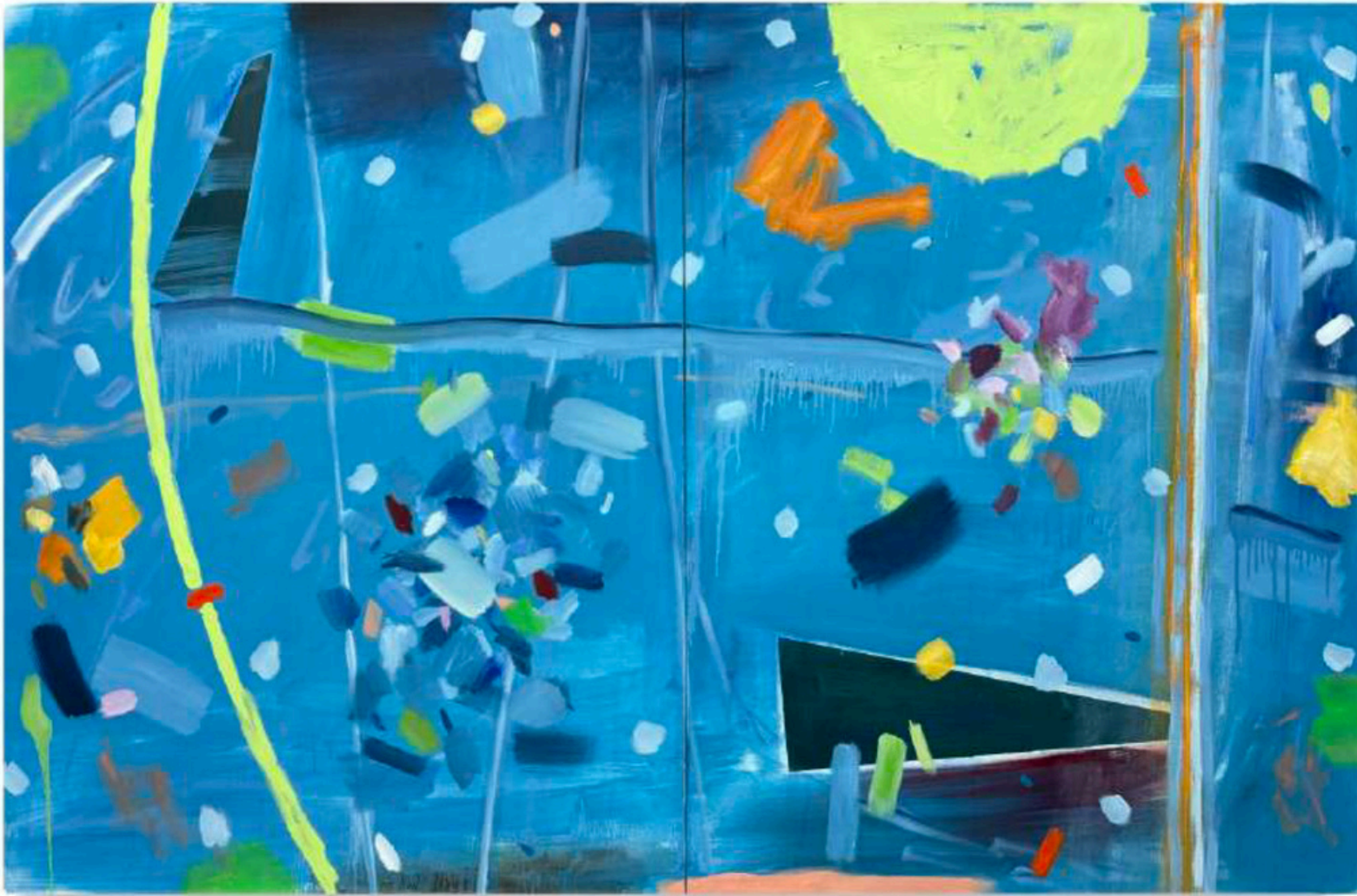
Daniel Roibal "Full moon" Oil on canvas 130 x 200 cm 6.400 € + IVA