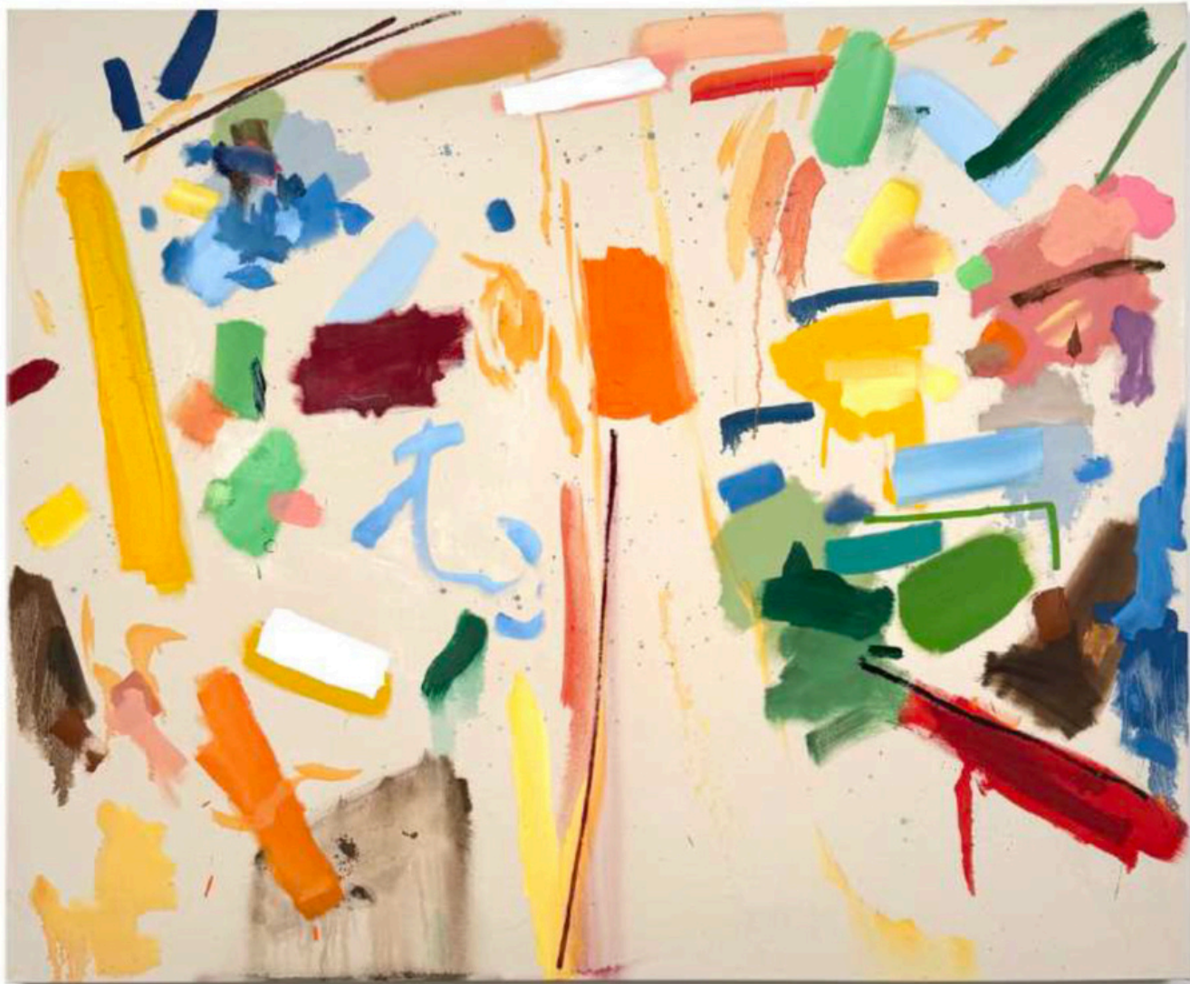
Daniel Roibal "Siesta bajo un naranjo" Oil on canvas 130 x 160 cm 5.600 € + IVA