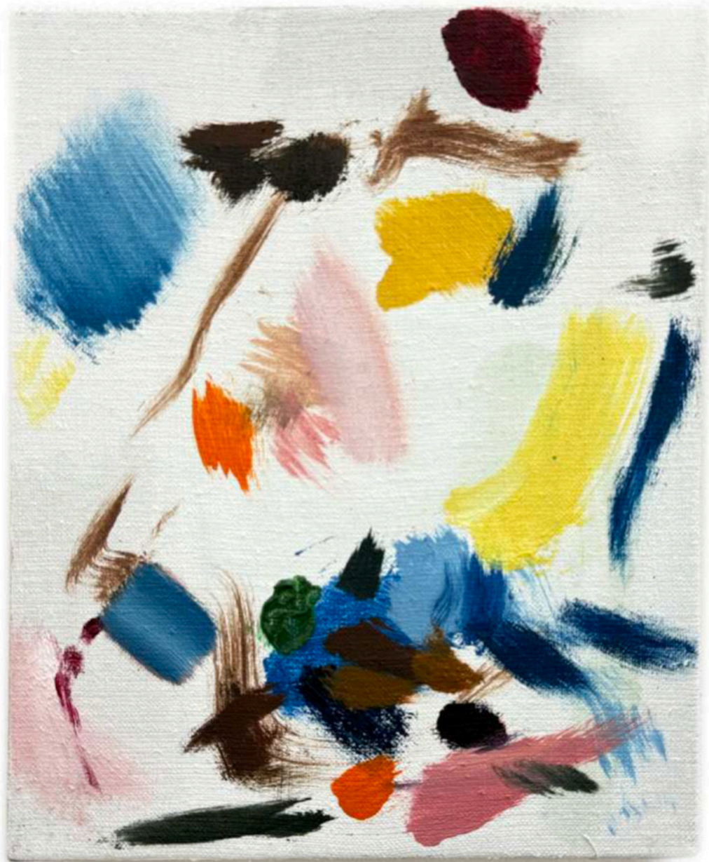
Daniel Roibal "Asiento 8 D" Oil on canvas 20 x 26 cm 900 € + IVA