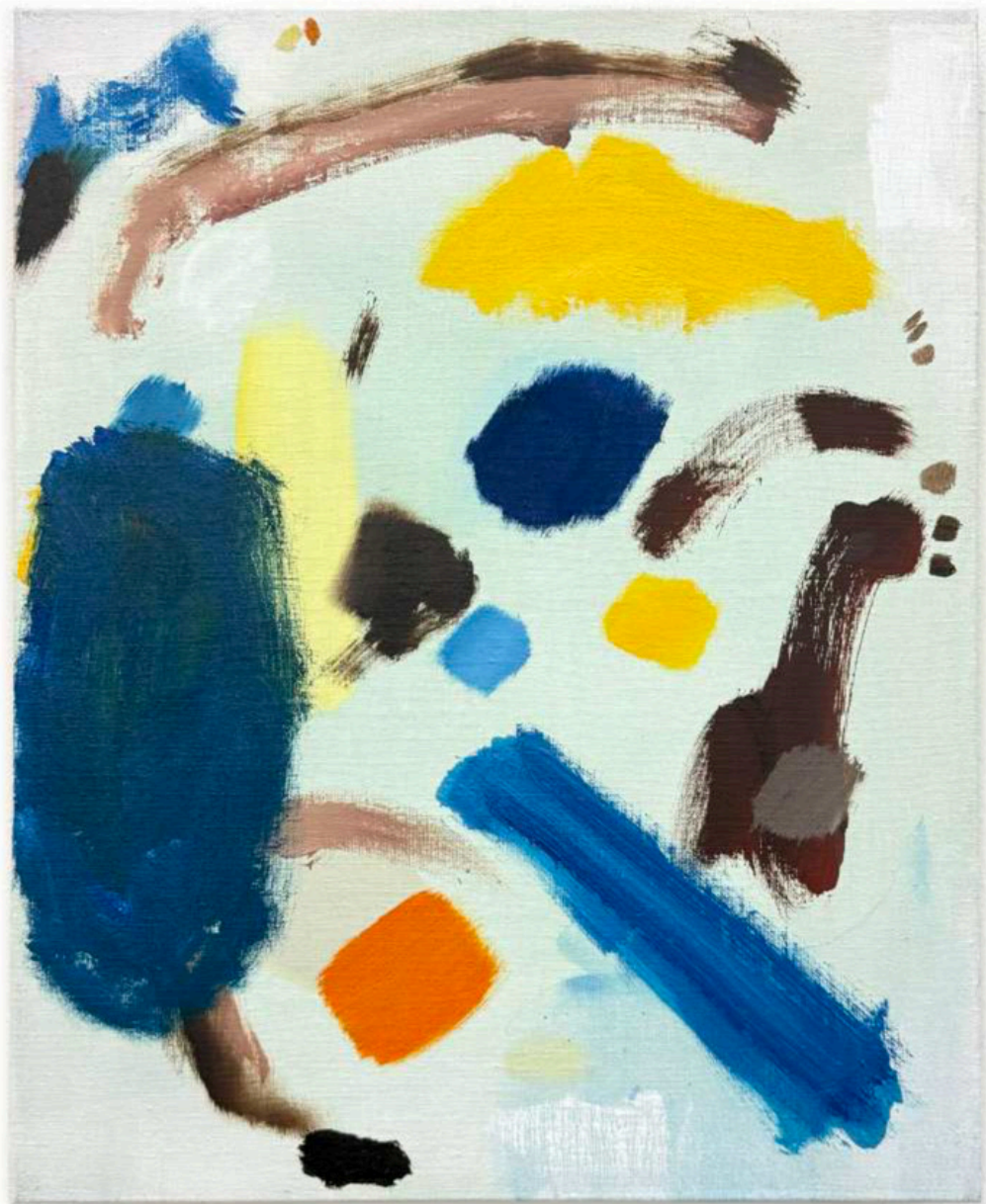
Daniel Roibal "Apaga la luz" Oil on canvas 50 x 40 cm 1.750 € + IVA