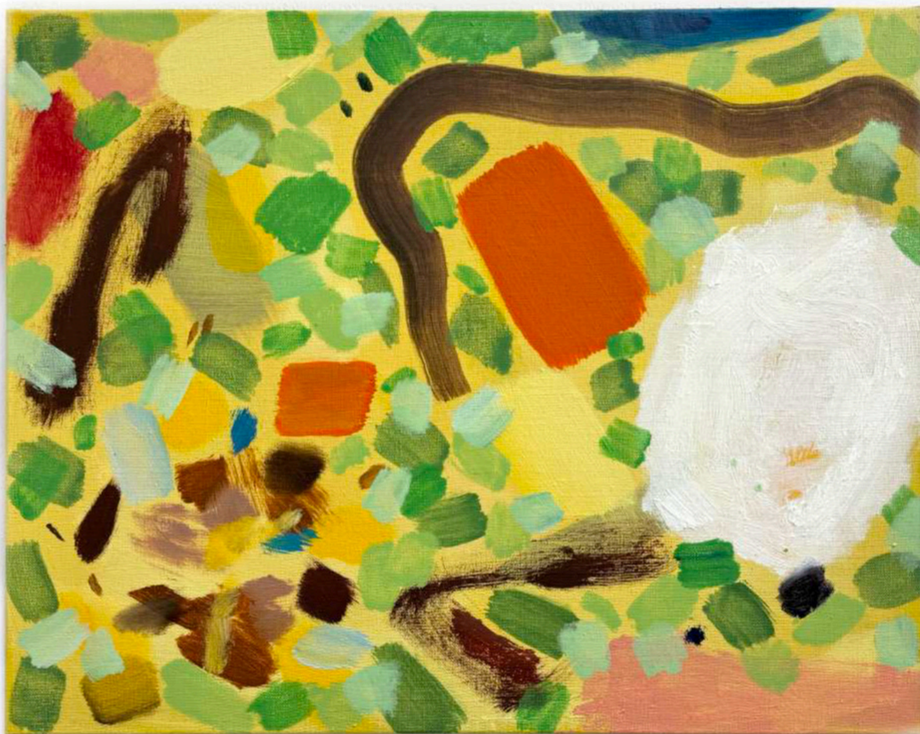
Daniel Roibal "Luz entre las hojas" Oil on linen 40 x 50 cm 1.750 € + IVA