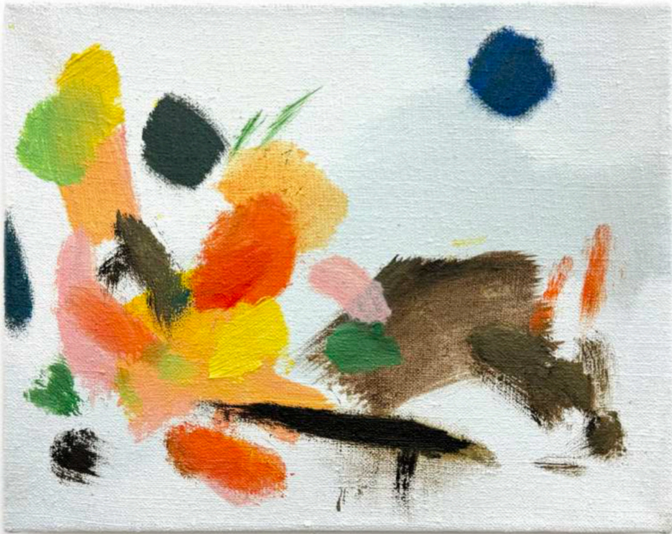
Daniel Roibal "Asiento 35 A" Oil on linen 20 x 26 cm 900 € + IVA