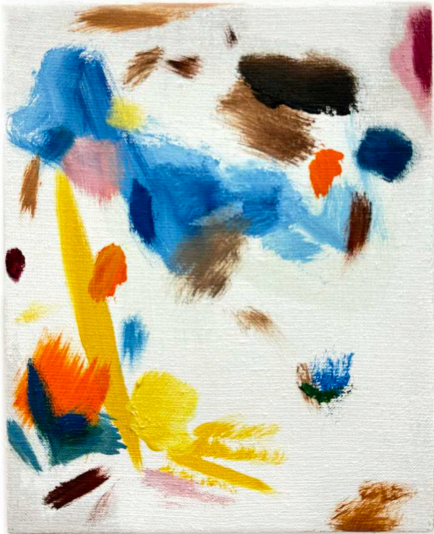
Daniel Roibal "Asiento 14 F" Oil on linen 20 x 26 cm 900 € + IVA